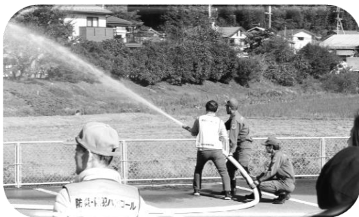
放水・筒先体験（平成30年度）