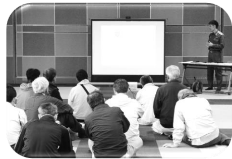
家庭内DIG講話（平成30年度）