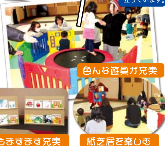
絵本もますます充実