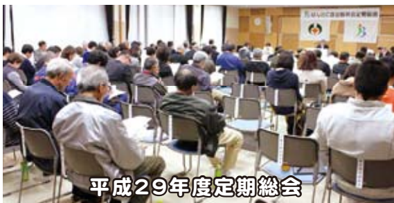
平成29年度定期総会

平成29年3月21日(火)、水口交流センター学習室において平成28年度定期総会を開催しました。甲賀市市民憲章を唱和ののち、平成29年度事業計画及び予算について審議され、原案通り承認されました。