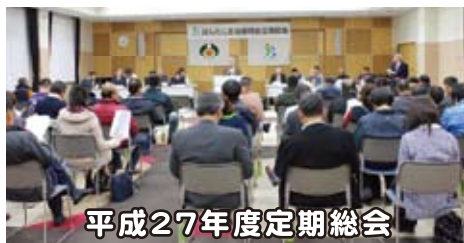
平成27年度定期総会

平成28年3月22日(火)、水口交流センター学習室において平成27年度定期総会を開催しました。甲賀市市民憲章を唱和ののち、平成28年度事業計画及び予算について審議され、原案通り承認されました。