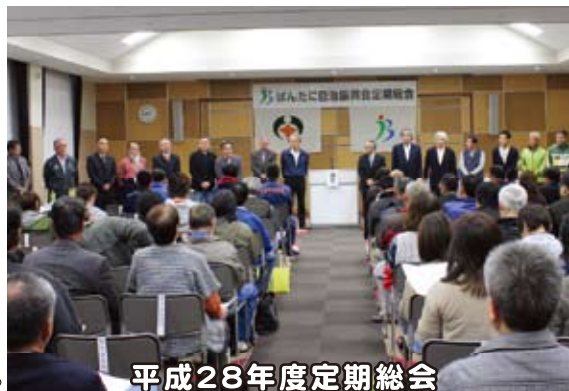
平成28年度定期総会

また、4月15日(金)には平成28年度定期総会を同じく水口交流センターにおいて開催し、平成27年度の事業報告及び決算、平成28年度役員について審議され、すべて賛成多数で承認されました。別表の新しい役員及び部会員の皆様とともに「元氣と笑顔あふれる自然豊かなまち伴谷」の実現のために、今年度事業に取り組んでまいります。伴谷地区の皆様の御支援・ご協力をよろしくお願いいたします。