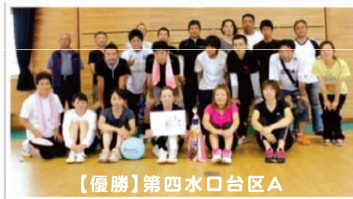
【優勝】第四水口台区A